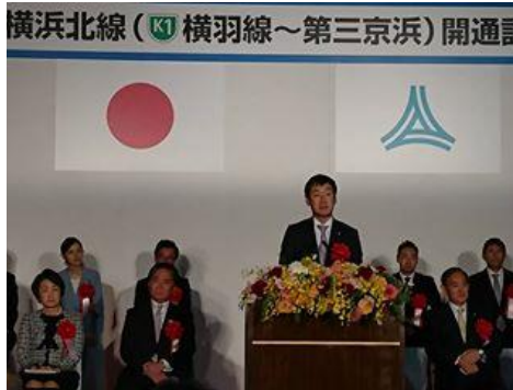
首都高・横浜北線開通式典にて挨拶