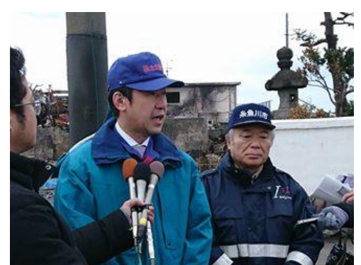
糸魚川大規模火災を現場確認し囲み取材