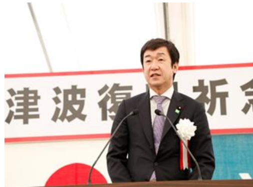
高田松原津波復興祈念公園起工式にて