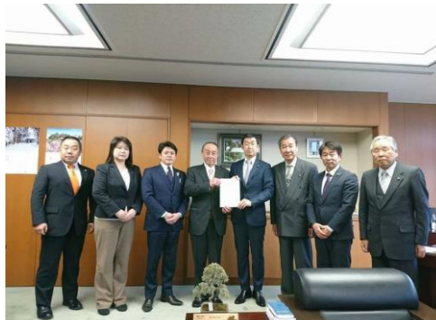
蕨駅ホーム事故再発防止策を進める