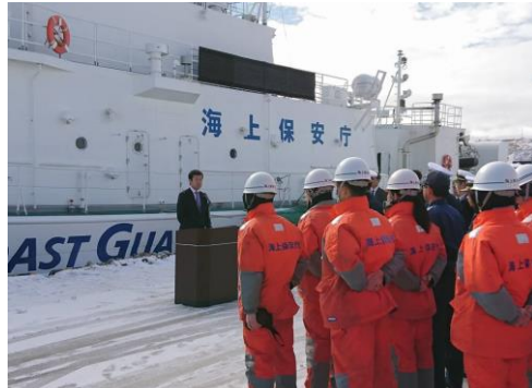
北方領土視察後、根室海上保安部を激励