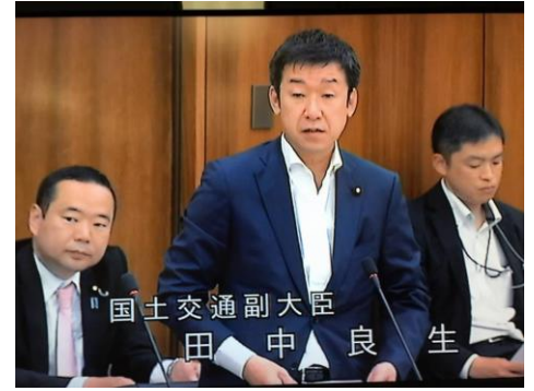
国土交通委員会にて答弁