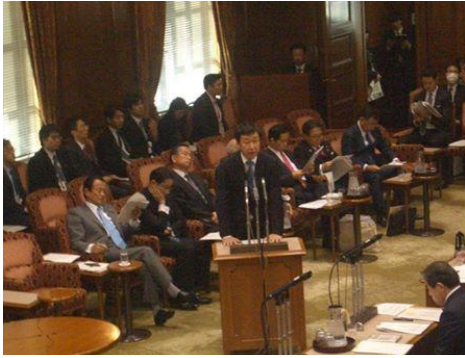
参院予算委員会にて答弁