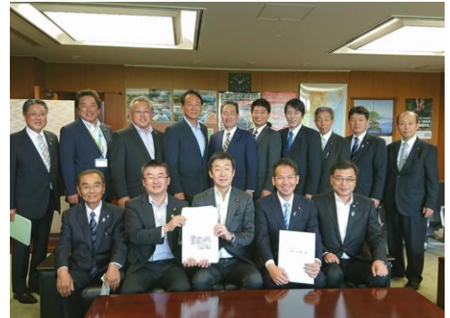
副大臣室にて様々な陳情を協議

第193回国会（常会）において、国土交通省関連で、「海上運送法」「住宅セーフティネット法」「都市緑地法」「水防法」「道路運送車両法」「不動産特定共同事業法」「通訳案内士法」「港湾法」「民泊新法」の9本の法律を成立させました。いずれも、安全・安心の確保、成長力の強化、地域の活性化の実現等にとって重要なものです。国家・国民のため、国土交通行政を着実に進めます。