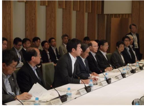
観光戦略タスクフォース@総理官邸にて提言