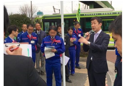
桜区通学路点検後に危険性除去を指示

県議、市議はじめ地元の方々のご要望・ご意見に真摯に向き合い、市民の安全・安心の確保に全力で取り組んで参りました。例えば、荒川の堤防改修等の治水対策、彩湖の活性化、JR 京浜東北線の蕨・北浦和・南浦和・西川口・川口等におけるホームドア設置の前倒し、桜区通学路の安全点検・対策（町谷北歩道橋架替、道場三室線交差部歩道橋新設、西堀歩道橋改修等）の実施、さらに、街の活性化のため、市街地再開発や区画整理、街路事業の推進等にも力を注いで参りました。