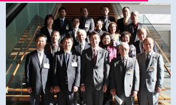
官邸雑壇にて記念撮影