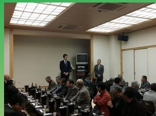
桜区「道場連合自治会忘年会」