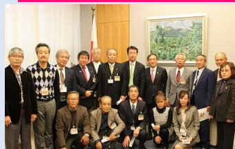
官房長官室にて菅長官と