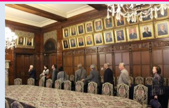
絢爛たる議長応接室