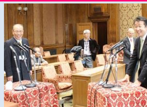
テレビ中継する第一委員室