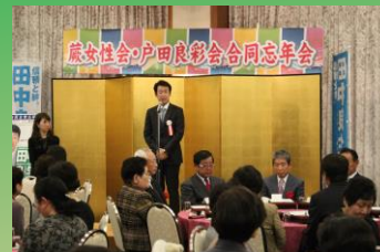
戸田市・蕨市「蕨女性会戸田良彩会合同忘年会」