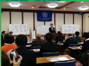
南区「南区倫理法人会」