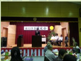
南区文蔵「お月見会」