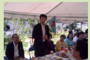
蕨市リゲソ「アウトバーフェスト」