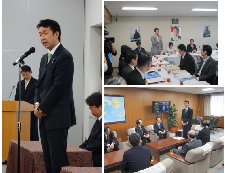
(左) 事務次官はじめ幹部職員 100名を前に抱負を

さらに、東日本大震災以降、我が国が直面しているエネルギー制約を克服し、 低廉かつ安定的な電力供給を一層進めていく上で、電力システム改革は不可欠です 。