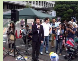
戸田市上戸田「ゆめまつり」