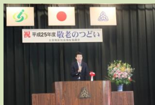
桜区土合「敬老の集い」