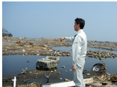
▲南相馬市原町地区にて

自民党は、震災発生直後から与野党の枠組みを超え、災害対応に全力で取り組んでいる。「各党・政府震災対策合同会議」を提案し、そして参加し、政府に対する全面的な協力を行ってきた。