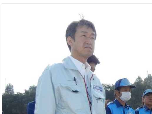
▲相馬市磯部地区にて

あらためて、政府には不要不急な政策の撤回と「この危機に国として全責任をもってあたる」との強い決意で対応されることを強く求めるものである。そして、単なる復旧ではなく国のかたちを変える機会ととらえ、究極の地方分権である道州制「東北州」構想の導入など、21世紀半ばの日本のあるべき姿を被災地で先取する、そんな希望あるビジョンを政治が示していくことが何よりも重要と考える。