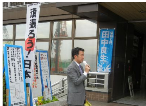
▲今、日本にとって必要なこと

新しい政治体制の下、今こそ「真の政治主導」をもって速やかに10兆円規模の補正予算を成立させ、本格的な復旧・復興と日本経済の再生に、与野党の枠を超え全力で取り組まなければならない。