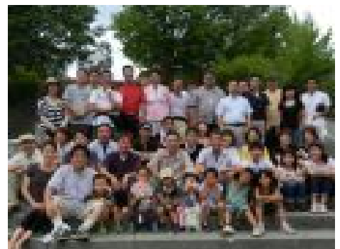
▲青年行動隊「クラブリンクス」

もはや政権を担当し続ける正当性はなくなった。民主党は、一日も早く党の公約をつくり直し、もう一度国民の信を問いなおすのが筋であろう。